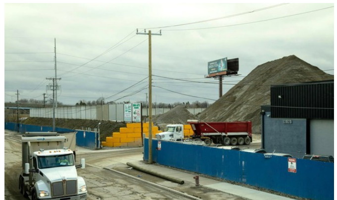
Montones de concreto triturado en Dino-Mite Crushing Recycling en Detroit.

Los camiones que transportan diversos materiales a menudo se observan con nubes de polvo saliendo del remolque, como en esta foto tomada por un residente de Detroit. 3